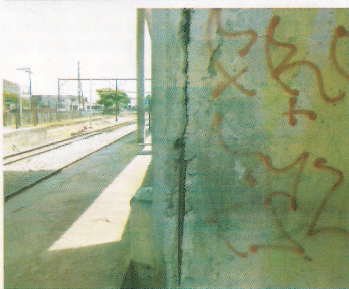
4) Estruturas danificadas, na passarela e plataformas da Estação de Lobato