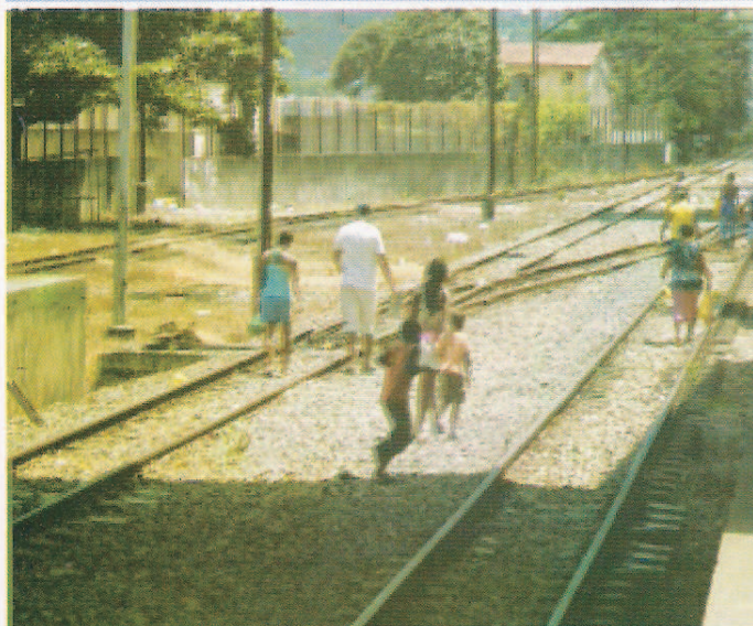
3) Travessia de passageiros sobre as vias férreas, no embarque e desembarque