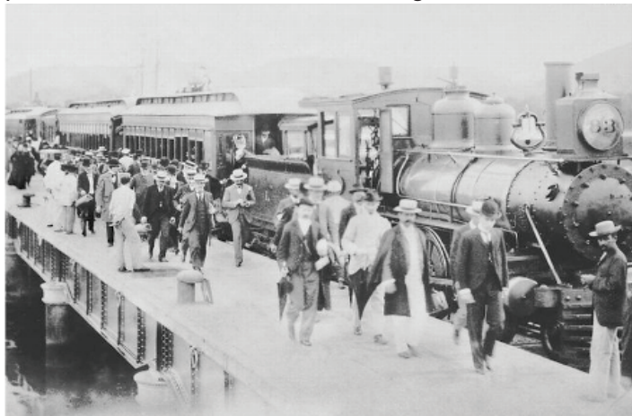
Estrada de Ferro Mauá, a primeira ferrovia do Brasil

Esperamos mais respeito das autoridades governamentais e as direções das empresas públicas e privadas com a nossa valorosa categoria.