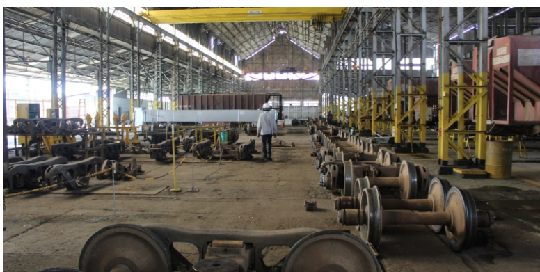
Área interna da oficina de vagões Arlindo Luz

O equipamento de Ponte Rolante, responsável pelo içamento dos vagões, está disposto também no sentido longitudinal, proporcionando o levantamento simultâneo das cabeceiras dos vagões, tornando a operação mais segura e diminuindo a probabilidade de ocorrências de acidentes.