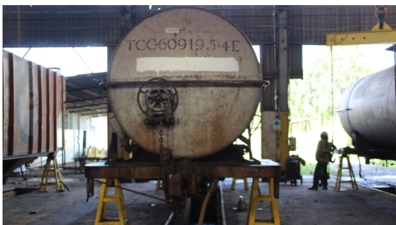
Oficina de vagões Arlindo Luz

O equipamento de Ponte Rolante, responsável pelo içamento dos vagões, está disposto também no sentido longitudinal, proporcionando o levantamento simultâneo das cabeceiras dos vagões, tornando a operação mais segura e diminuindo a probabilidade de ocorrências de acidentes.