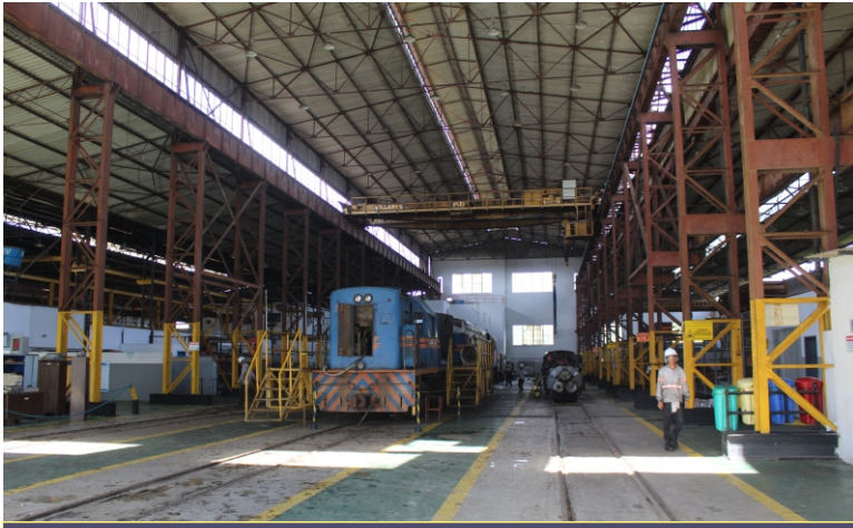
Área interna da oficina de locomotivas Osvaldo Rios

O SINDIFERRO, desde 2013 com o surgimento da Resolução 4.131/2013, da Agência Nacional de Transportes Terrestres (ANTT), vem alertando a categoria sobre o desinteresse da Ferrovia Centro-Atlântica S/A (FCA/VLI) em operar o sistema de transportes de cargas pela ferrovia no Estado da Bahia. Em Sergipe, o último trem de carga trafegou em 2007.