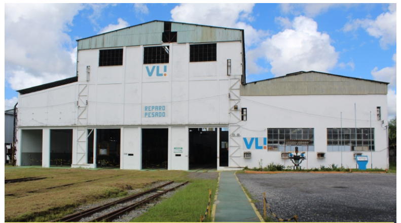
Oficina Osvaldo Rios (área externa)

A FCA/VLI alega o seguinte com esse projeto: melhorar a comunicação entre as áreas, solucionando os problemas de forma mais ágil e eficaz, além de fazer a integração da produtividade, otimização da relação interpessoal, aumento da confiabilidade da informação e redução das despesas com o administrativo.