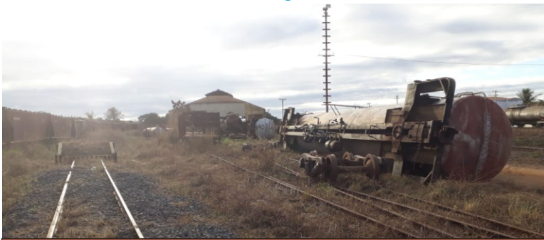
Restos de vagões abandonados em Licínio de Almeida-BA

O SINDIFERRO acompanhará todo o desenrolar das providências que a empresa vier a tomar (se é que vai), e, dará conhecimento aos órgãos fiscalizadores.