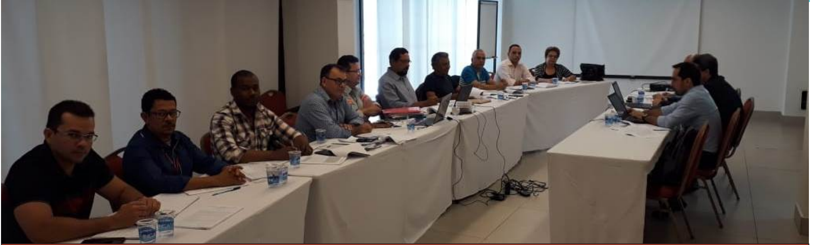
Mesa negocial da 3ª Rodada, em Belo Horizonte-MG

Valendo pela 3ª Rodada de Negociação, que ocorreu em 21 de agosto de 2018, em Belo Horizonte/MG, a Ferrovia Centro-Atlântica S/A apresentou contraproposta para uma cláusula econômica, a qual ficou pendente pelo Sindicato: “Iniciando a discussão dos itens econômicos a empresa propôs o reajuste, a partir de 01 de setembro de 2018, sobre os salários-base de seus empregados ativos em 31 de agosto de 2018, pelo INPC integral do período (01 de setembro de 2017 a 31 de agosto de 2018), ainda a ser divulgado”.