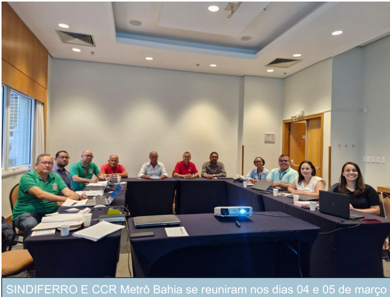
SINDIFERRO E CCR Metrô Bahia se reuniram nos dias 04 e 05 de março

N os dias 04 e 05 de março do ano em curso, os diretores do SINDIFERRO participaram da primeira e segunda rodadas de negociações, de forma presencial, para celebração do Acordo Coletivo de Trabalho 2024/2025 dos Metroviários (as) com data-base 1º de março.