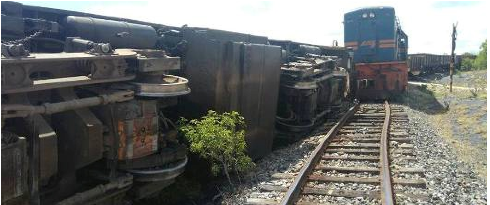
Diante das péssimas condições da ferrovia, acidentes estão cada vez mais frequentes

DENÚNCIA ! FERROVIA DO MEDO E DAS DEMISSÕES APÓS SUCATEAR TRECHOS FERROVIÁRIOS DA BAHIA E SERGIPE, EMPRESA QUER DEVOLVER CONCESSÃO AO GOVERNO FEDERAL